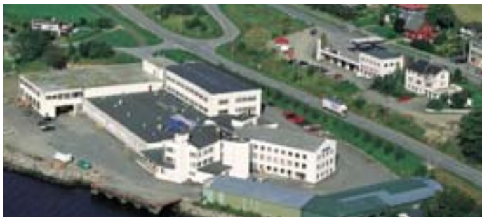
Dept. Vestlandske Stressless®, employees: 200