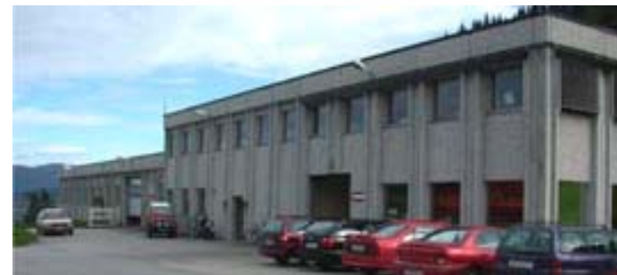
Dept. Tynes Laminering, employees: 40