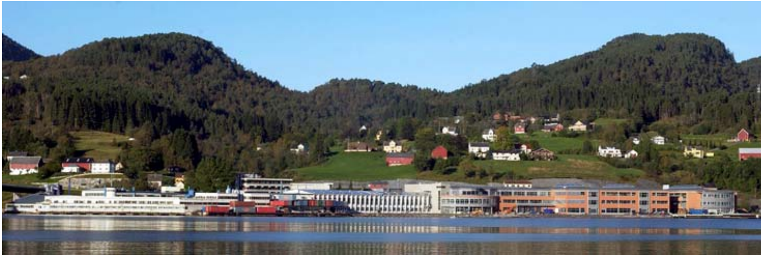
J.E. Ekornes AS Stressless®, employees: 655